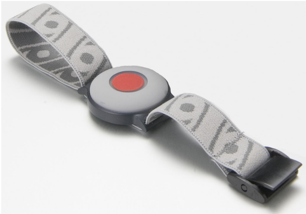
Veekindel häirenupp Tx4 koos mugava reguleeritava randmepaelaga